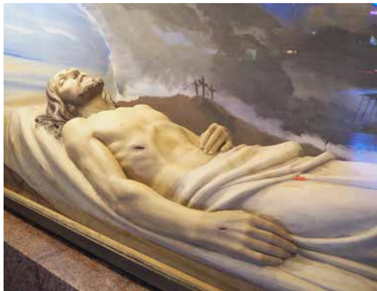
Altare della Madonna della rosa. Cristo nel sepolcro